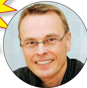
Av: Bernt Caspersson

Aktimportstödet har till uppgift att underlätta inläggningen av e-postmeddelanden och dokument i KLARTEXT. I version tre har några intressanta nyheter tillkommit, bland annat versionshantering av Worddokument.