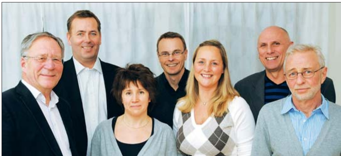
KLARTEXT-gruppen, från vänster:

Nyhetsbladet i Klartext Advokatsystem ges ut av SoftIT SK AB Ansvarig utgivare: Bo Myrén Besöksadress: Esplanaden 3D, Sundbyberg Box 1252, 171 24 SOLNA Tfn: 08-705 80 10 Fax: 08-705 80 55 hemsida: www.softit-sk.se i Klartext produceras av: Ulf Hansson Text & Bild och Text å Form AH AB