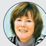
Inger Björå Systemutveckling