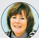
Inger Björå Systemutveckling