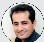
Winay Camaly Systemutveckling