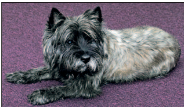
Cairnterriern Ready, 11 år, är alltid redo och har koll på vad som händer på kontoret.

Förutom svensk och internationell affärsjuridik är advokaterna verksamma som konkursförvaltare, rekonstruktörer och likvidatorer. Byrån håller även kundanpassade utbildningar inom de olika specialområdena.