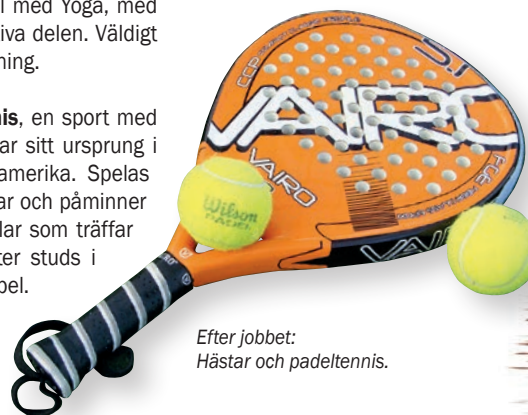
Efter jobbet: Hästar och padeltennis.